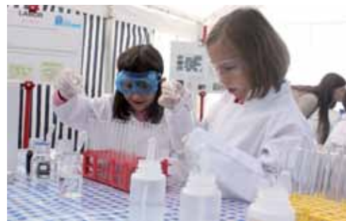
Schon die Jüngsten waren mit Begeisterung bei den Erlebnistagen der Mürztaler Kläranlagen dabei.

Wissenschaftler des Lehrstuhls für Abfallverwertungstechnik und Abfallwirtschaft organisierten gemeinsam mit dem Mürztalverband an den Kläranlagen im Mürztal Erlebnistage für Schüler. Dabei konnten sie hautnah erleben, wie Schmutzwasser wieder trinkbar wird und wie Kompostierung funktioniert.