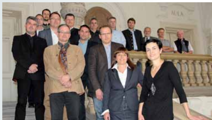
Die Teilnehmer des Netzwerktreffens

Besonders positiv ist, dass das Qualifizierungsnetz „Primärrohstoffe“ am 22. Juni 2014 als „Beispielprojekt“ in einer Presseaussendung des bmwfw genannt wurde.