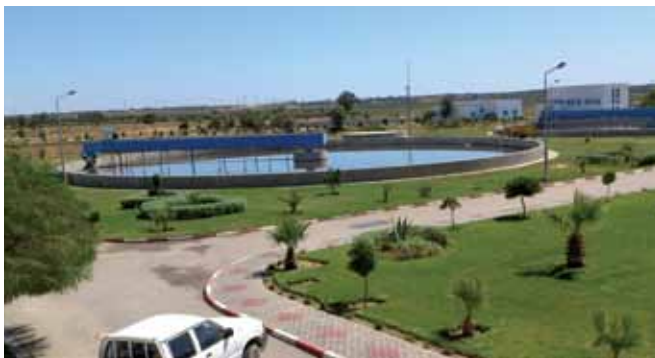
Nachklärbecken der Anlage Kairouan 2

Zusammenfassend war mein Auslandspraktikum bei ILF sowohl fachlich als auch persönlich ein sehr interessantes und wertvolles Erlebnis. Sowohl die Kollegen im Projektbüro in Tunis als auch die Mitarbeiter des Hauptbüros in Salzburg und Rum/Innsbruck haben mich jederzeit bestens unterstützt und mir diese tolle Erfahrung ermöglicht. Anderen interessierten Studenten kann ich nur empfehlen, sich ebenfalls für ein Auslandspraktikum zu bewerben, Ihr werdet es nicht bereuen!