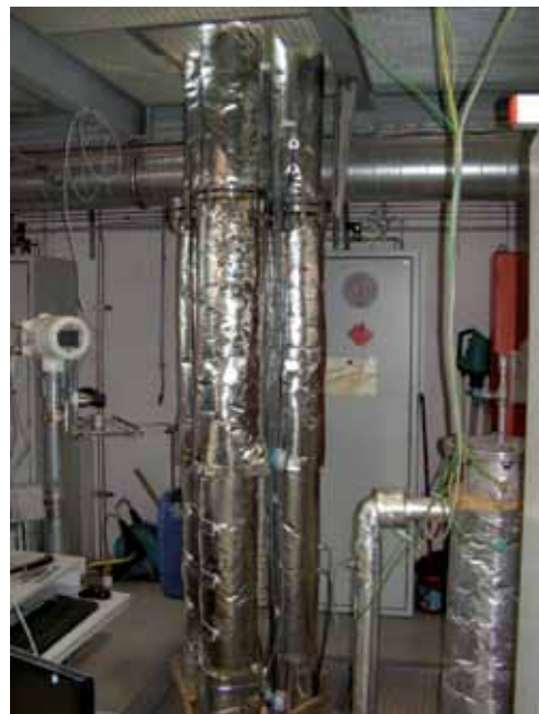
Druckreaktoren zur Untersuchung des Gemischverhaltens von H_2/CH_4 -Verbindungen

Das im Frühjahr präsentierte Projekt befindet sich mittlerweile bereits in der Abwicklung. Die Planungen für das Testbed, d. h. die probeweise Einspeisung von Wasserstoff in einen Untertageporenspeicher, schreiten voran.