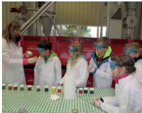
Begeisterte Schüler beim Projekt „Trash up“

Das Projekt wurde als Kooperation vom Abfallwirtschaftsverband Feldbach, der Fa. Saubermacher, Pro Kultur und dem Lehrstuhl für Abfallverwertungstechnik und Abfallwirtschaft durchgeführt. Insgesamt waren rund 300 Kinder und Jugendliche in das Projekt involviert.