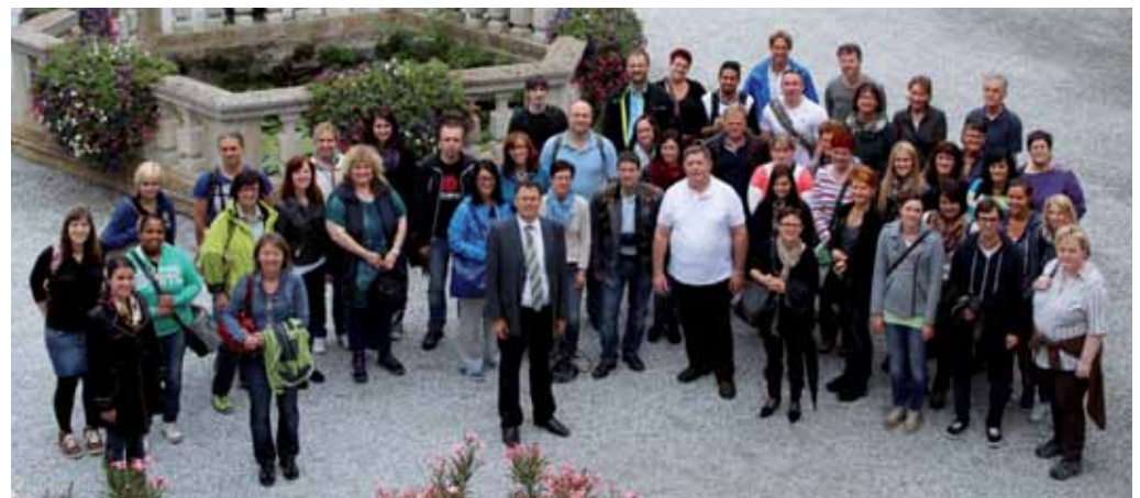
Betriebsausflug der Zentralen Dienste

Der diesjährige Betriebsausflug der Zentralen Dienste führte in die Oststeiermark. Zuerst wurde das Schloss Herberstein besichtigt, danach konnten der Tierpark und der wunderschöne Rosengarten besucht werden. Besonders interessant dabei war eine kommentierte Puma-Fütterung. Am Nachmittag begaben sich dann alle in eine gemütliche Buschenschank, um bei guter Jause den Betriebsausflug ausklingen zu lassen.