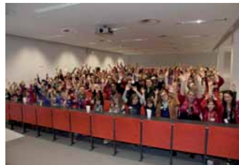
Rund 100 Pfadfinder besuchten die Montanuniversität.

Ungefähr 100 Wichtel und Wölflinge (dabei handelt es sich um Pfadfinderkinder von sieben bis zehn Jahren) waren im Mai auf der Montanuniversität Leoben, um zu „studieren“. Die Schüler teilten sich am Vormittag in die Studienrichtungen auf und bestritten einen Wettkampf um ECTS-Punkte. Dazu mussten möglichst viele Vorlesungen der verschiedenen Studienrichtungen besucht werden. Dabei gab es unter anderem das Werkstofflabor, in dem man die Eigenschaften verschiedener Materialien bestimmte oder die Diamantenmine und die Goldgräberstation, in denen man sich bergmännisch betätigte. Auch der Unichor und das USI waren mit Stationen vertreten.