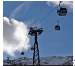
Skifahren wird wieder teurer.

Tirol alleine in den vergangenen fünf Jahren teilweise um fast 40 Prozent gestiegen. Am teuersten wird es für die Wintersportler, wie auch schon im Vorjahr, bei den Arlberger Bergbahnen. Dort kostet das Ticket bis zu 78 Euro, um vier Prozent mehr als im letzten Winter. Vergleicht man diesen Preis mit dem Jahr