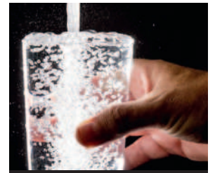
Das Trinkwasser ist nun überall freigegeben worden.