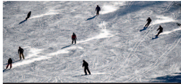
Liftpreise steigen in Tirol um drei bis zehn Prozent.

Viele Salzburger zieht es an schönen Tagen auf den Hausberg. Mitunter ist der Verkehr an sonnigen Wochenenden Richtung Gaisbergspitze so stark, dass am Gipfel ein Chaos herrscht. Mit der Aktion soll die Natur ein wenig geschont werden.