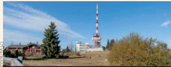
Am Sonntag bleibt die Gaisbergspitze wieder autofrei.

Salzburg. Am Sonntag von 9 bis 16 Uhr verwandelt sich der Gaisberg wieder in eine autofreie Zone. Zwischen der Abzweigung der Brauhausstraße und der Gaisbergspitze gilt dann für alle Kraftfahrzeuge ein Fahrverbot – davon ausgenommen sind Anrainer und Gäste der Betriebe mit Reservierungsbestätigung. Mit dieser Aktion setzen die Stadt